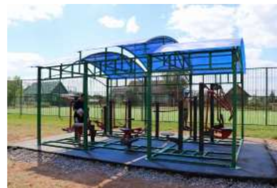
В Торопце ежегодно устанавливаются уличные тренажерные площадки и игровые комплексы. Одна из них – на ул.Полежаева