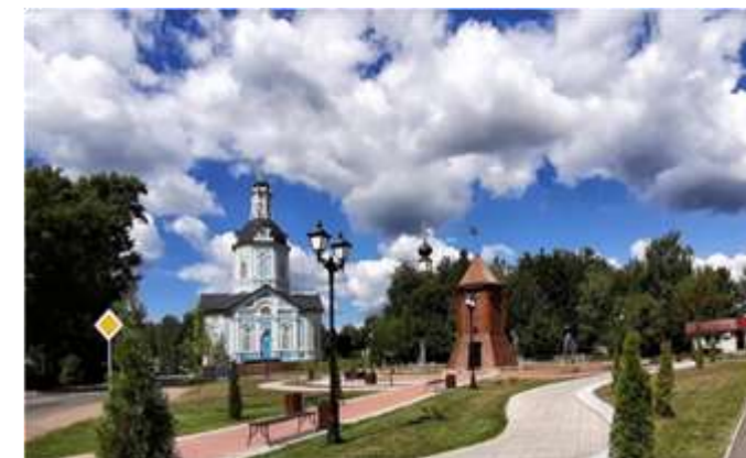
Вид на сторожевую башню и Свято-Тихоновский женский монастырь