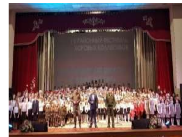
В Районном Доме культуры проводится более 300 мероприятий в год