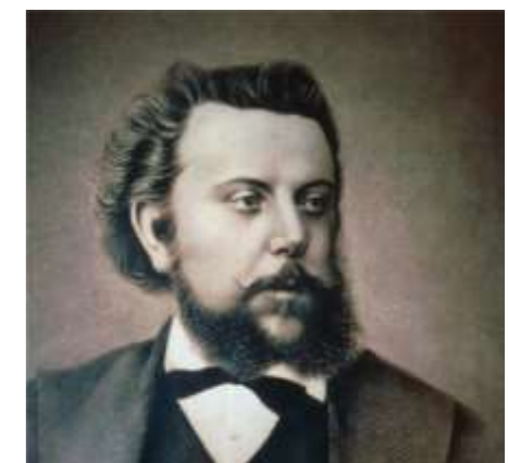
Композитор М.П. Мусоргский