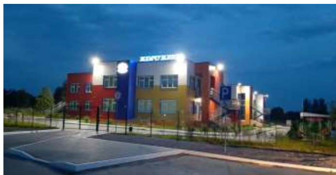
В 2021 году в Торопце открыт самый крупный в Тверской области современный детский сад «Жемчужинка» на 240 мест

Сегодня Торопец - это уютный, современный и очень активный город, административный центр Торопецкого района – одного из динамично развивающихся и успешных муниципалитетов Тверской области.