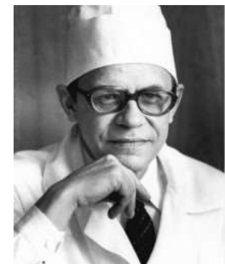
Академик, кардиолог В.А. Алмазов – выпускник средней школы № 1 г.Торопца