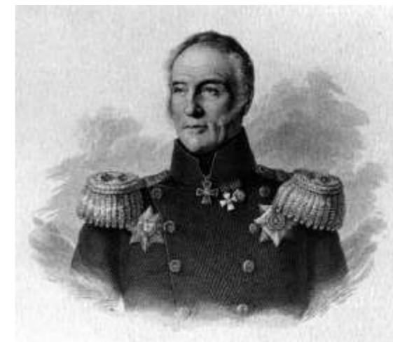
адмирал П.И. Рикорд