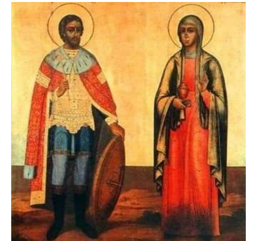
Св.блгв.кн. Алескандр Невский с супругой