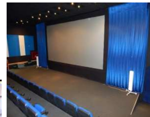
Современный 3D кинотеатр