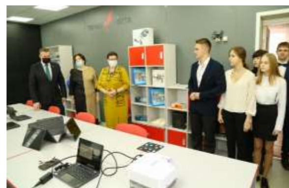
Современные центры цифрового и гуманитарного образования открыты в средних школах города