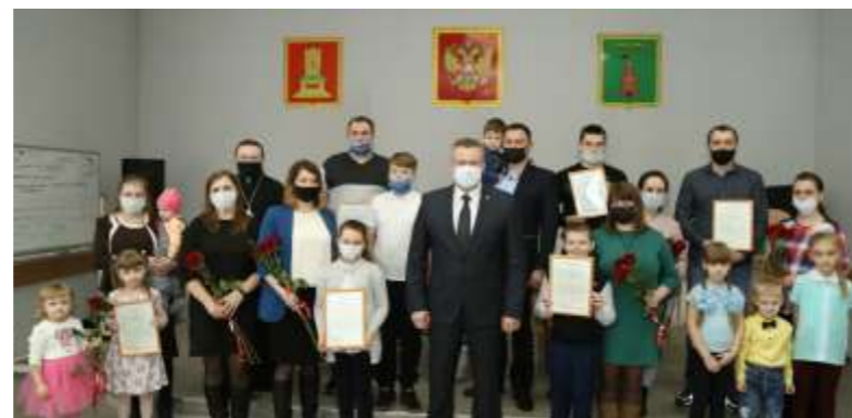
Ежегодно молодым семьям вручаются сертификаты на улучшение жилищных условий