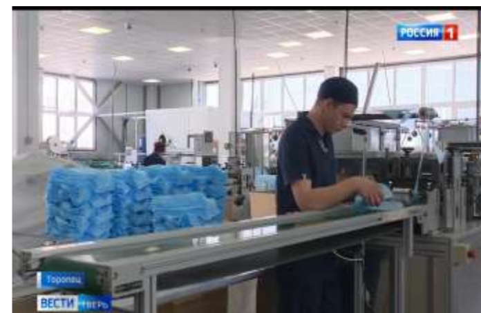
ООО «ГЕКСА – нетканые материалы» одно из крупнейших производств, выпускающих одноразовую медицинскую продукцию