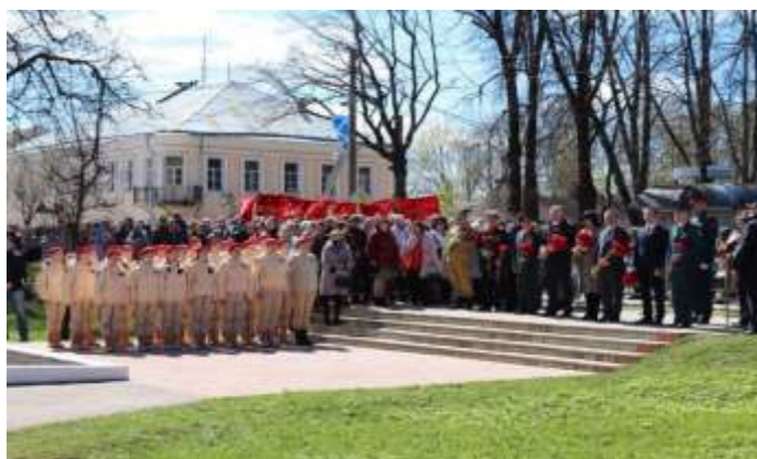
Празднование 9 мая