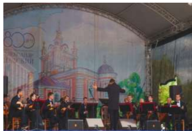
Празднование 800-летия со дня рождения Святого Благоверного Князя А.Невского