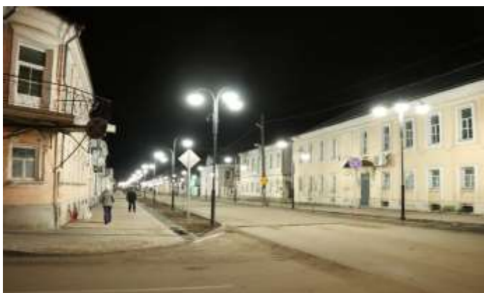
ул.Советская после реновации