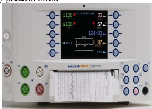
Figure 1: Sonicaid Team («Oxford Instruments Medical», Great Britain)

At present, to determine the status of antenatal fetus often use fetal monitors Sonicaid Team («Oxford Instruments Medical», UK) with the program "System 8000". Criteria for evaluation of CTG automated data in real time have been designed G.Dawes, C.Redman and M.Moulden and are based on multivariate statistical retrospective clinical evaluation of tens of thousands of CTG. The data is compared with the patient's specific regulatory credible indicators, taking into account the duration of pregnancy. Using of this program is already possible from 24 weeks of pregnancy, that is, with the terms of the very early preterm birth.