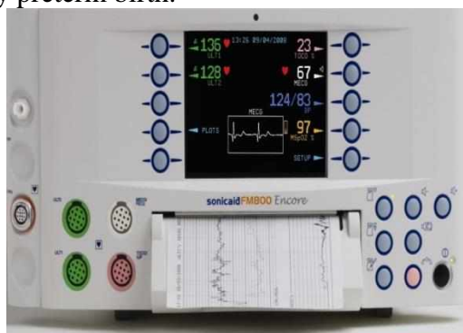
Figure 1: Sonicaid Team («Oxford Instruments Medical», Great Britain)

At present, to determine the status of antenatal fetus often use fetal monitors Sonicaid Team («Oxford Instruments Medical», UK) with the program "System 8000". Criteria for evaluation of CTG automated data in real time have been designed G.Dawes, C.Redman and M.Moulden and are based on multivariate statistical retrospective clinical evaluation of tens of thousands of CTG. The data is compared with the patient's specific regulatory credible indicators, taking into account the duration of pregnancy. Using of this program is already possible from 24 weeks of pregnancy, that is, with the terms of the very early preterm birth.