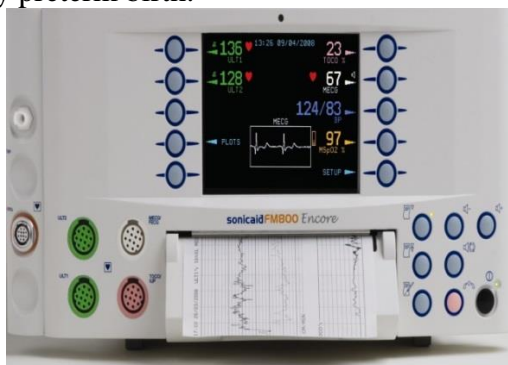
Figure 1: Sonicaid Team («Oxford Instruments Medical», Great Britain)

At present, to determine the status of antenatal fetus often use fetal monitors Sonicaid Team («Oxford Instruments Medical», UK) with the program "System 8000". Criteria for evaluation of CTG automated data in real time have been designed G.Dawes, C.Redman and M.Moulden and are based on multivariate statistical retrospective clinical evaluation of tens of thousands of CTG. The data is compared with the patient's specific regulatory credible indicators, taking into account the duration of pregnancy. Using of this program is already possible from 24 weeks of pregnancy, that is, with the terms of the very early preterm birth.